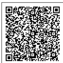
Ilustración 1 QR de ejemplo

https://catalogo-ypfe.dian.gov.co/document/searchqr?documentkey=e5bac48e354bc907bccff0ea7d45fbf784f0a8e7243b58337361e1fbd430489d